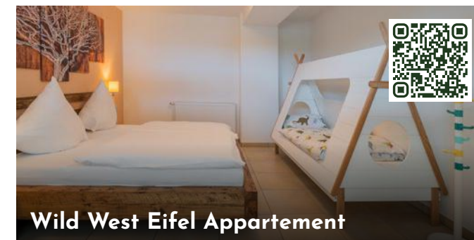
Wild West Eifel Appartement

In der Nebensaison geänderte Öffnungszeiten