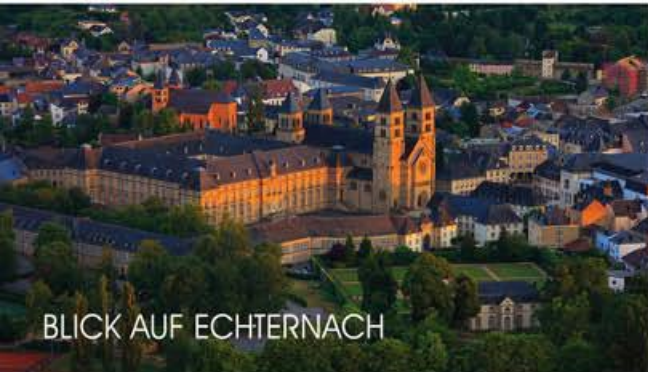
BLICK AUF ECHTERNACH