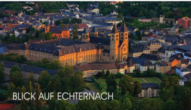
BLICK AUF ECHTERNACH